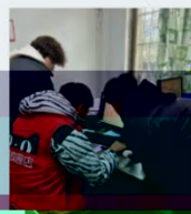
同学们在线下门店实训场景